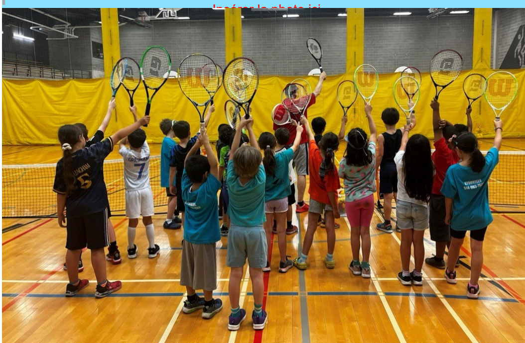
Semaine 1 : À la découverte des Galaxies

Afin de nous assurer que le dossier médical de votre ou vos enfants soit à jour et que les semaines de camp que vous avez sélectionnées soient les bonnes, nous vous invitons à vérifier dans votre compte en ligne les informations suivantes. Ces informations sont obligatoires :